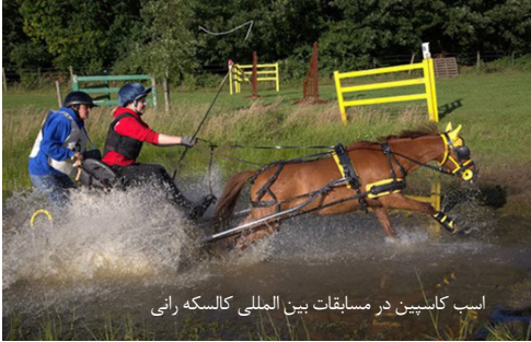
اسب کاسپین در مسابقات بین المللی کالسکه رانی

تدوین و اجرای استانداردها، روش ها و ثبت داخلی و بین المللی اسبهای کاسپین و تالشی، ثبت سیلیمی، تولد، تلفات و نقل و انتقال مالکیت اسبها، شناسایی اسبها، تولیدکنندگان، مالکان، پژوهشگران و علاقه مندان، تدوین، بروز رسانی و انتشار کتاب تبارنامه اسب کاسپین، برگزاری جشنواره، رویداد، همایش، کنفرانس، دوره های آموزشی داخلی و بین المللی در کلیه زمینه های مرتبط با اسب کاسپین از جمله حوزه های فرهنگی، هنری، ورزشی و پرورش تکنیک های تولید مثل و اصلاح نژاد، حمایت و تشویق مالکین و تولیدکنندگان اسب کاسپین بویژه در مناطق محروم، انجام فرآیند شناسایی اسبها و میکروچیپ گذاری و نظارت بر کلیه تست ها و فرایندهای مرتبط با آن، عضویت، ارائه مشاوره و همکاری با انجمن بین المللی اسب کاسپین و انجمن های ملی سایر کشورها، سمن ها و سازمان های مرتبط داخلی و خارجی، حمایت از تولیدکنندگان، پژوهشگران و ارائه آموزش های تخصصی به بهره برداران و علاقه مندان به اسب کاسپین، حفاظت از حقوق مالکیت مادی و معنوی پرورش دهندگان اسب کاسپین، همکاری با مراکز علمی و دانشگاهی