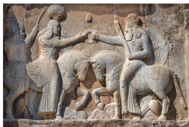
سنگ‌نگاره اهورامزدا و اردشیر بابکان - نقش رستم