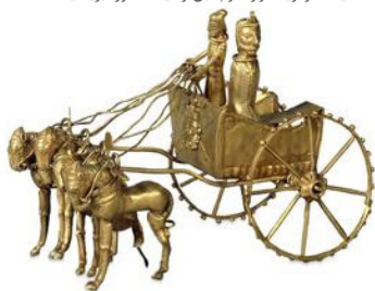
ارابه طلایی، گنجینه آمودریا (هزاره دوم قبل از میلاد)، موزه بریتانیا