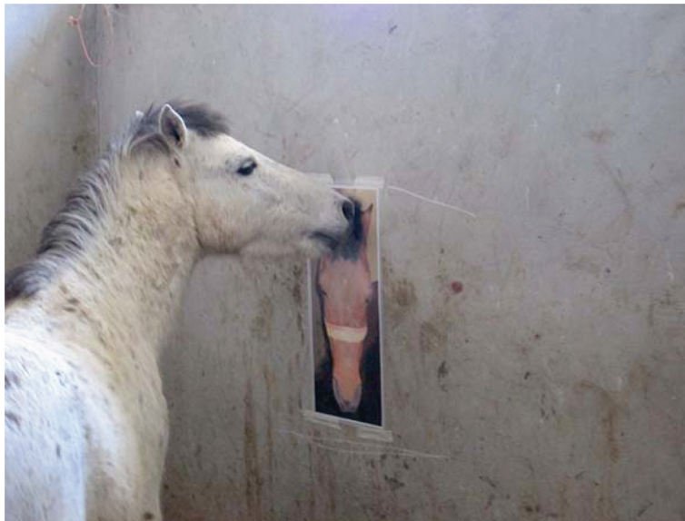
شکل ۶- باکس اول

در باکس شماره سه که تصاویر اسبچه آرام و اسبی از نژاد دیگر (سفید