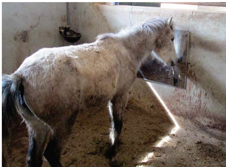
شکل ۷- باکس چهارم