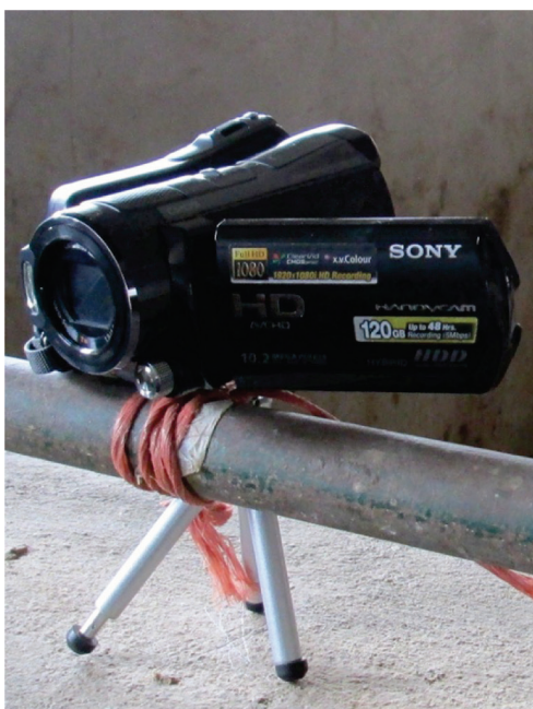
شکل ۲- دوربین فیلمبرداری مورد استفاده در این تحقیق به همراه ریموت و نحوه نصب آن در بین باکس‌ها با قابلیت چرخش بین دو باکس

تصاویر چاپ شده‌ی رنگی با کیفیت بالا در ابعاد طبیعی از سر اسبچه خزر با مشخصات زیر: الف) حالت روحی نرمال و طبیعی حیوان (شکل ۳)