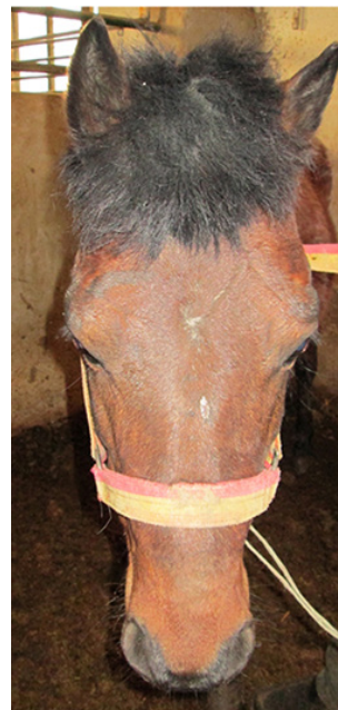
شکل ۳- حالت روحی نرمال و طبیعی حیوان

ب) حالت روحی خشمگین و تهاجمی با گوش‌های خوابیده (شکل ۴) ج) حالت روحی نرمال و طبیعی حیوان بصورت مات و شطرنجی شده (Phasi)