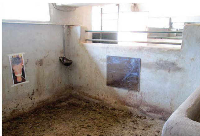
شکل ۵- نصب آینه در باکس