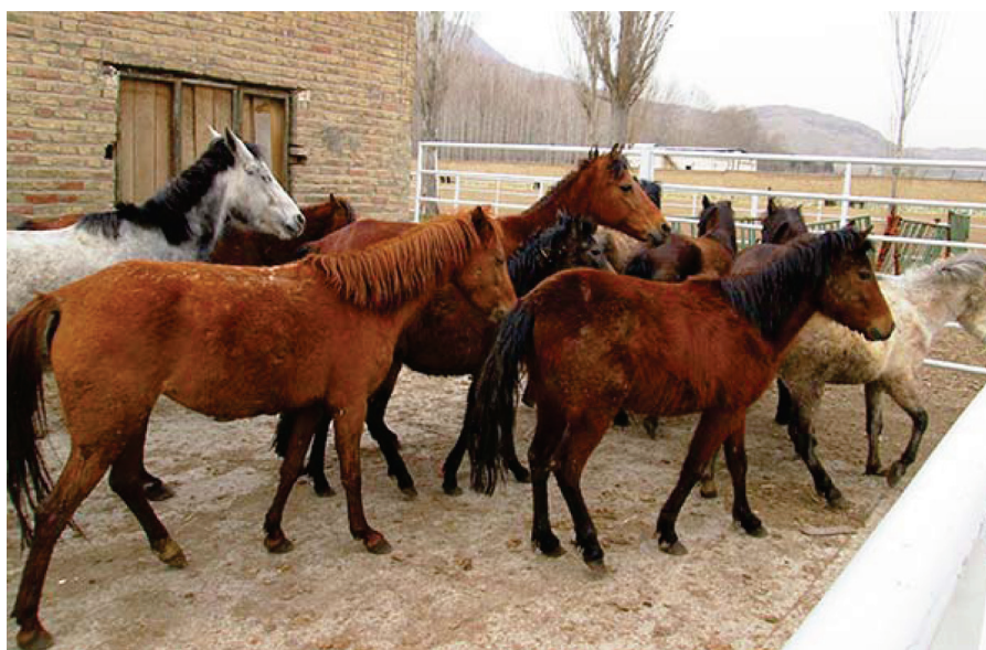
شکل ۱- تعداد ۱۰ راس اسبچه خزر مورد استفاده در آزمایش

دوربین فیلم برداری: تعداد ۲ دوربین فیلم برداری Sony HD که توسط ریموت کنترل دستی هدایت می‌شد (شکل ۲).